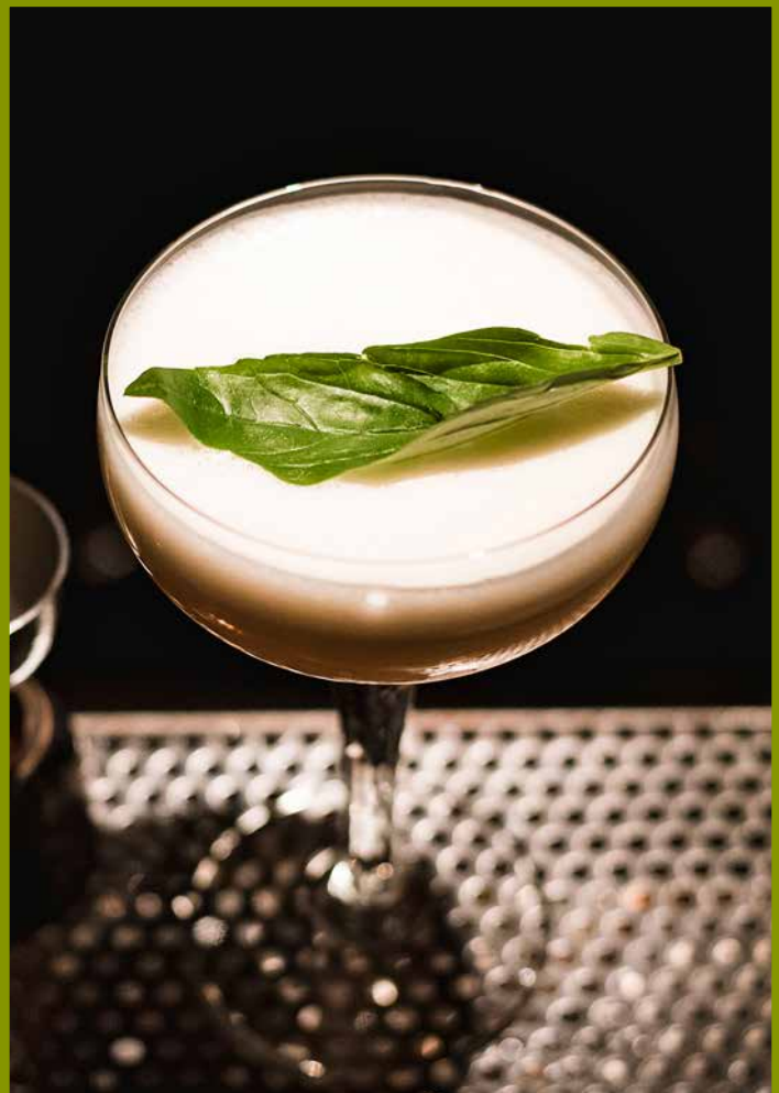
Athens, BABA AU RUM – Baba Au Rum Cocktail

No word can describe this bar better than its name. Both the food and the drinks (Pedro Manhattan!) are outstanding! The décor is a cross between bistro and gastro pub. Well worth checking out – as indeed is the nearby Mayakovskaya subway station. Don't miss either!