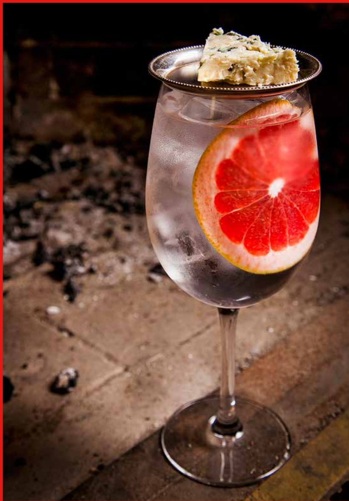
Moscow, DELICATESSEN – Smoked G&T