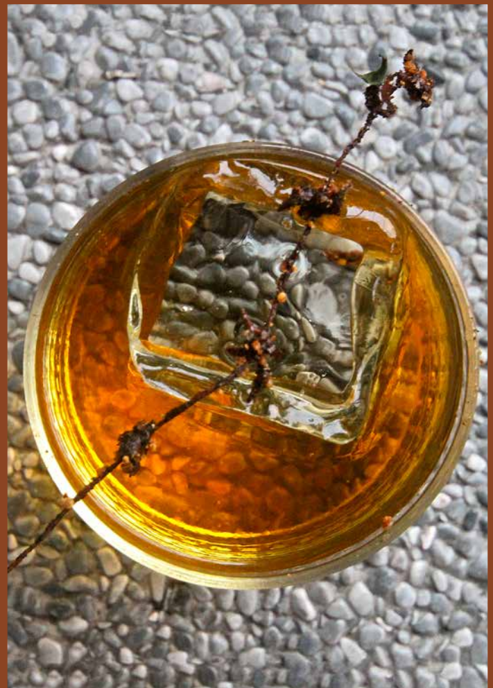
Singapore, OPERATION DAGGER – Bee Pollen

At the entrance, there's little indication of the bar behind. But if you've seen the logo on the website, it's one you're sure to remember. This is a genuine lab with a bar in the look of an Aesop shop. And design fans are sure to delight in the sheer range of creativity inside.