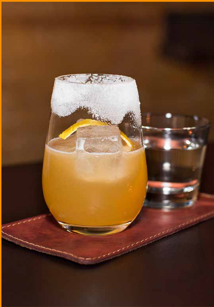
Frankfurt, SEVEN SWANS & THE TINY CUP – Crusta Famosa